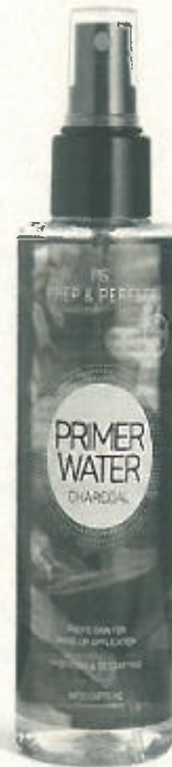
PS...PREP & PERFECT PRIMER WATER CHARCOAL