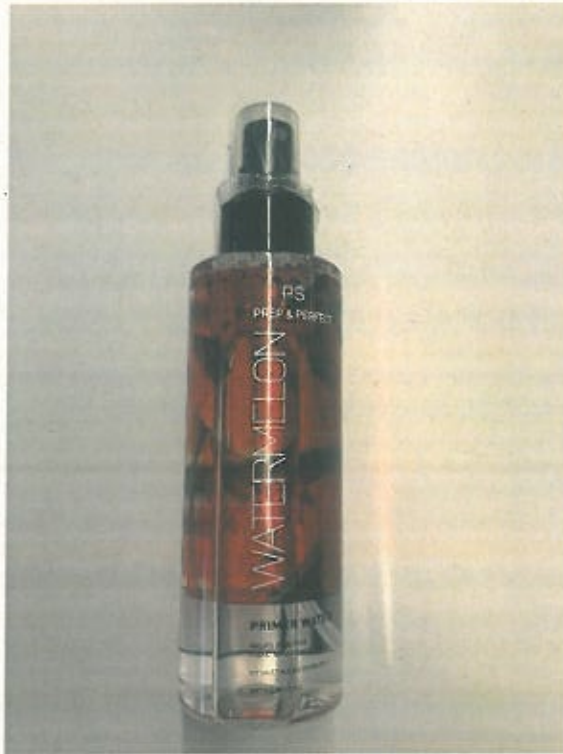
PS...PREP & PERFECT WATERMELON PRIMER WATER