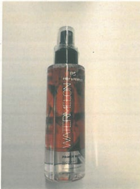
PS...Prep & Perfect Watermelon Primer Water