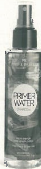
PS...Prep & Perfect Primer Water Charcoal